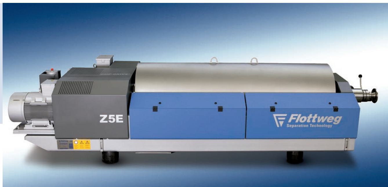
FLOTTWEG СУРИМИ ДЕКАНТЕР Z5E

Все детали, соприкасающиеся с продуктом, изготавливаются из высококачественных нержавеющей сталей (AISI 316 Ti/Duplex). Электрополировка шнека. Сварное крепление направляющих барабана. Петлевая крышка обеспечивает удобный доступ к ротору во время чистки и обслуживания. Программируемые процессы промывки CIP.