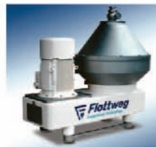
Тарельчатый сепаратор FLOTTWEG AC 2500

ваны в «специфику» производства казеина и лактозы. Тарельчатый сепаратор-осветлитель FLOTTWEG завершает ряд оборудования фирмы FLOTTWEG для молочной промышленности.