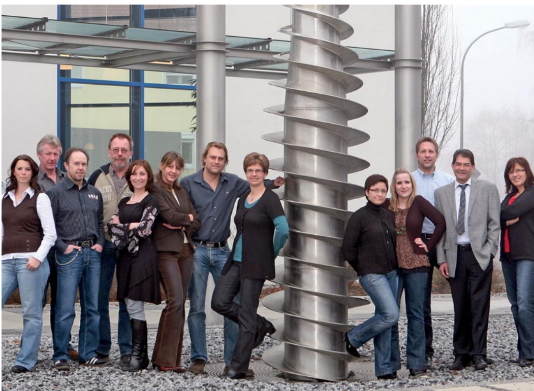
Ihr FLOTTWEG Service-Team in Vilsbiburg