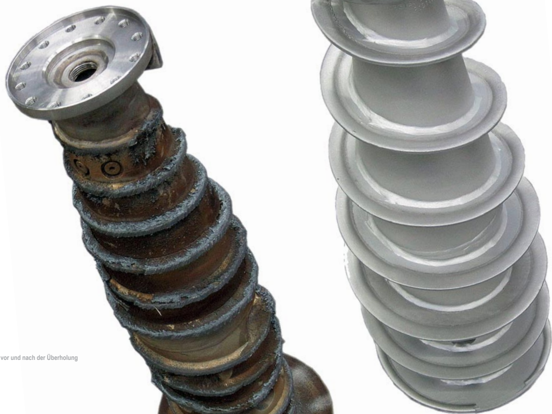
Schnecke vor und nach der Überholung

Nutzen Sie das Know-how und die Möglichkeiten des Herstellers.