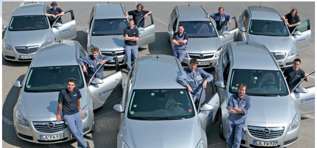
Die FLOTTWEG Servicetechniker stehen stets für Sie bereit

Die Adressen der FLOTTWEG Servicestationen aller Auslandsniederlassungen finden Sie auf unserer Website www.flottweg.com .